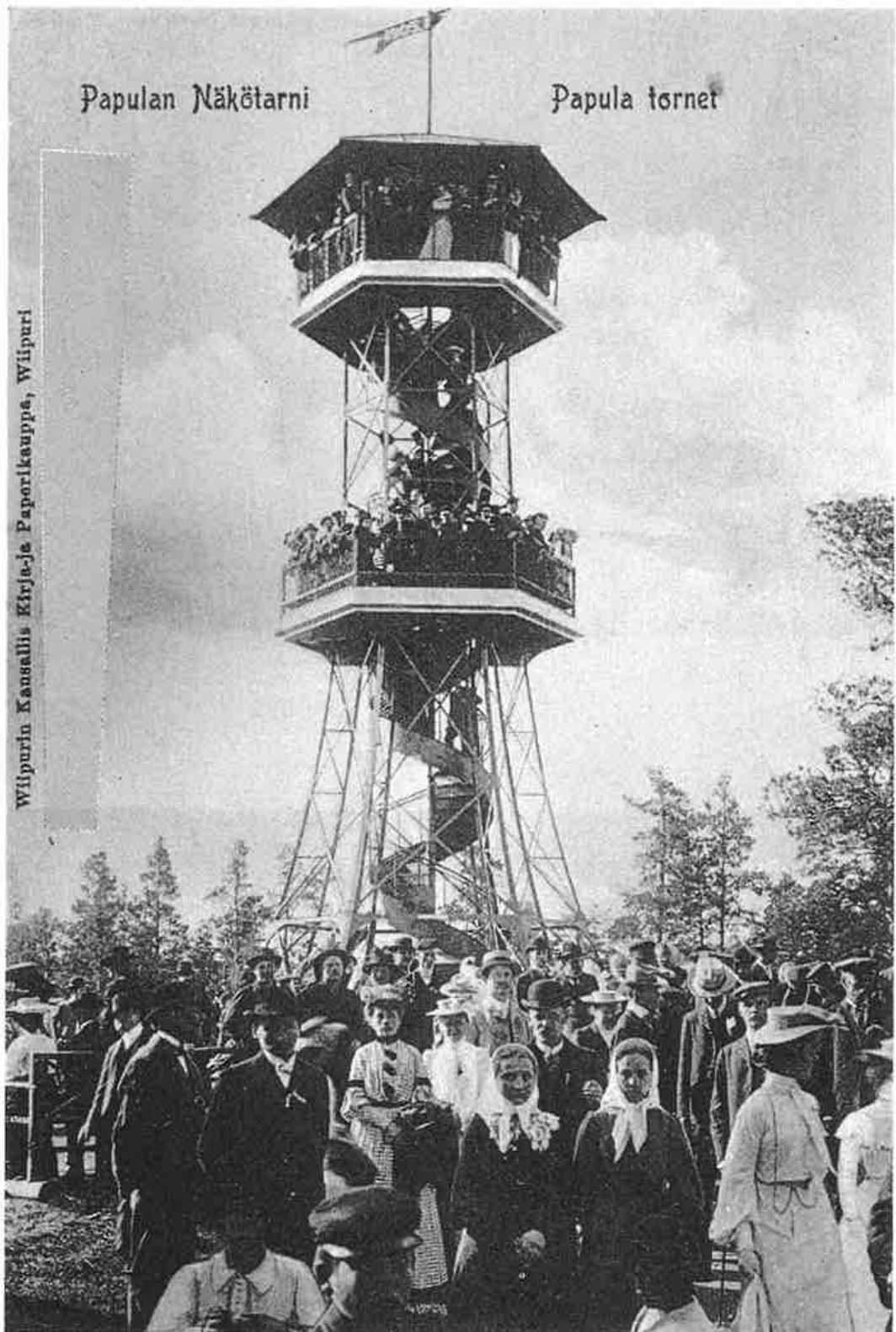
Papulan näkötorni "Pilipuu".