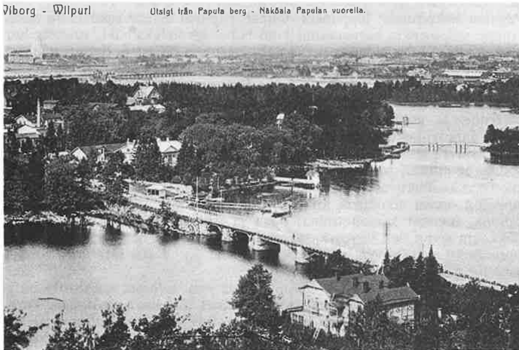
Papulaa näkötornilta katsottuna.