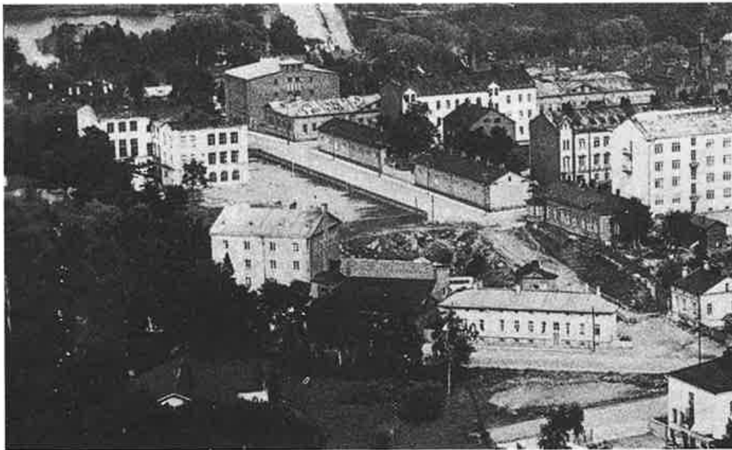
Papulaa, vasemmalla kansakoulu.