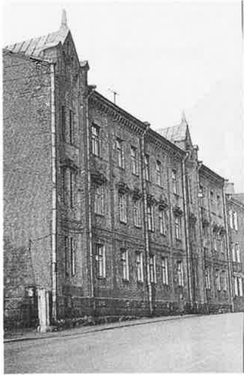
Nykyäänkin pystyssä oleva talo Majurinkadulla.