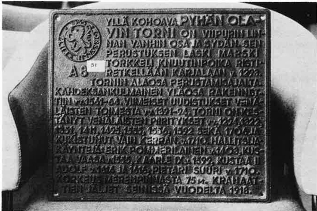
Torkkelin Killan ja Matkailijayhdistyksen Viipurin osaston teettämä pronssikilpi, joka naulattiin 29.4.1939 Viipurin linnan porttirakennuksen seinään.