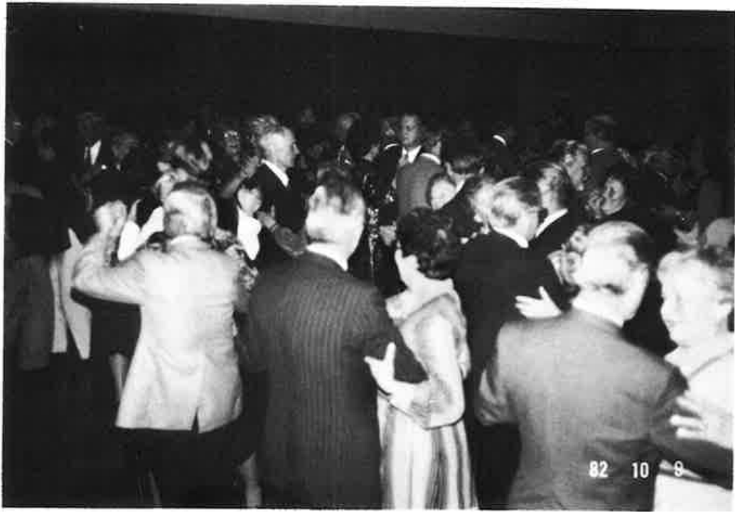
”Torkkeli tanssii” 10.10.1982 Marskin ravintolassa.