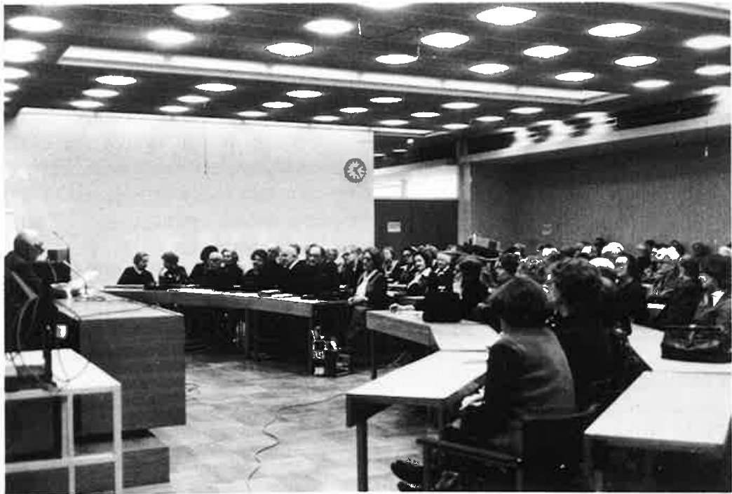
Torkkelin kiltalaisia Studia Generaliassa v. 1977.