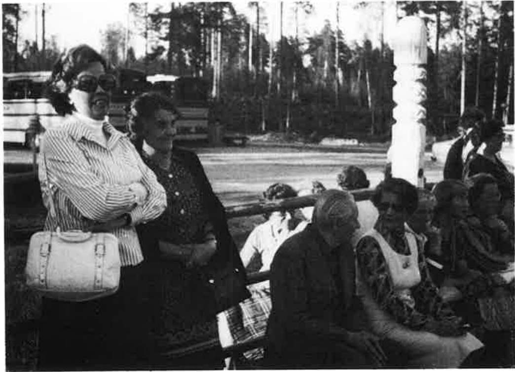
Torkkelin kiltalaisia retkellä Pohjois-Karjalassa Bomban talon pihalla 4.6.1980.