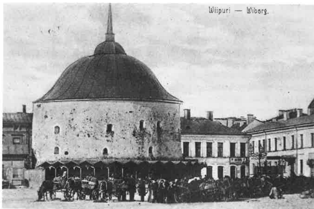
Pyöreätorni ja sen seinän juuressa kahvikojut. Valokuva v. 1890.

Vuonna 1860 annettiin torni ”kaikkein korkeimmasta käskystä” kaupungin viranomaisten huostaan, että nämä maksutta purkauttaisivat sen maan tasalle. Samaan aikaan oli kaupungin purettava joukko muitakin linnakkeita ja valleja Sarvilinnoituksen alueella, ja seuraavina vuosina hävisi moni muistoista rikas muuri antamaan tilaa uusille kaduille, aukioille ja puistoille (mm. Torkkelinkadulle ja -puistolle). Kauppatori ja keskuspuistot sommiteltiin, mutta onneksi säästyivät Pyöreätorni, ehkä siitä syystä ettei tornia lu-