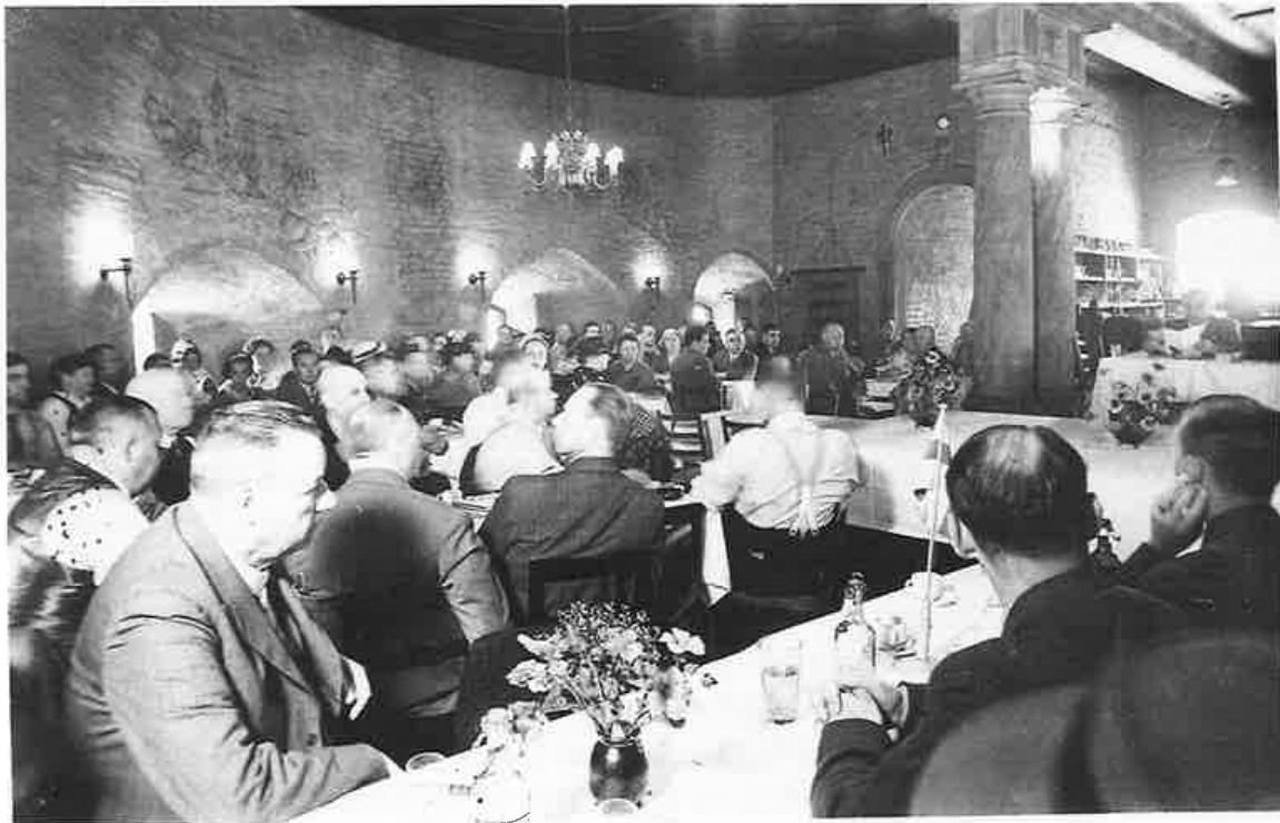
Pyöreän tornin ravintola 1930-luvulla.