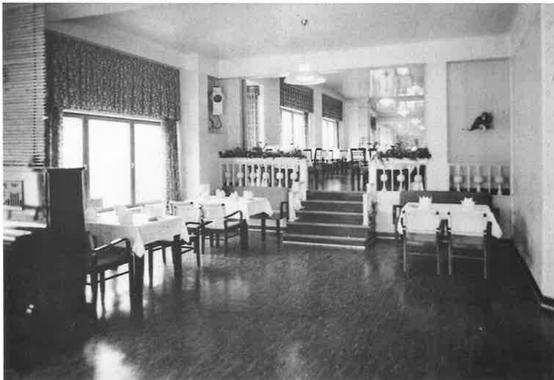
Ravintola Lehtovaara.