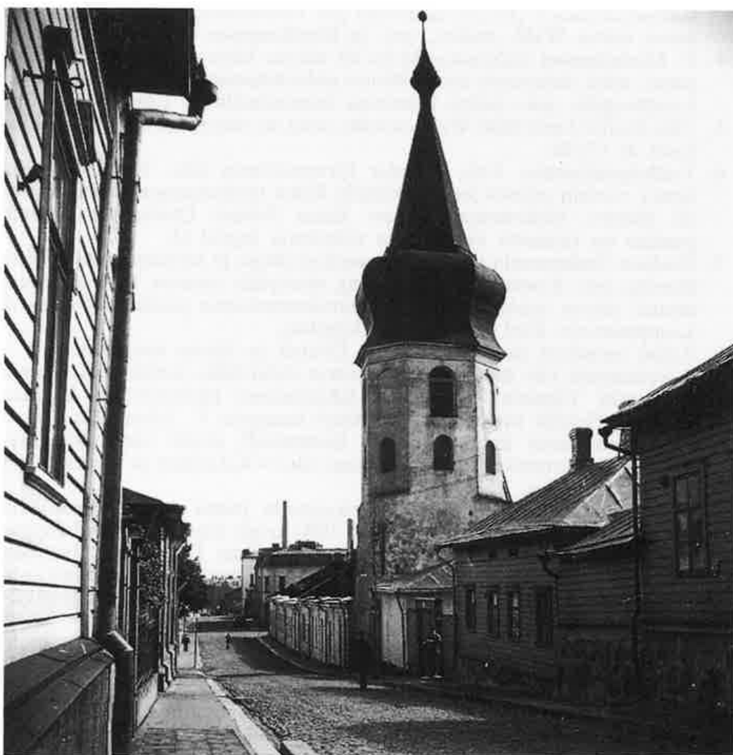
Näkymä Keisarinkadulta (myöh. Luostarikadulta) (Museoviraston historian kuva-arkisto).