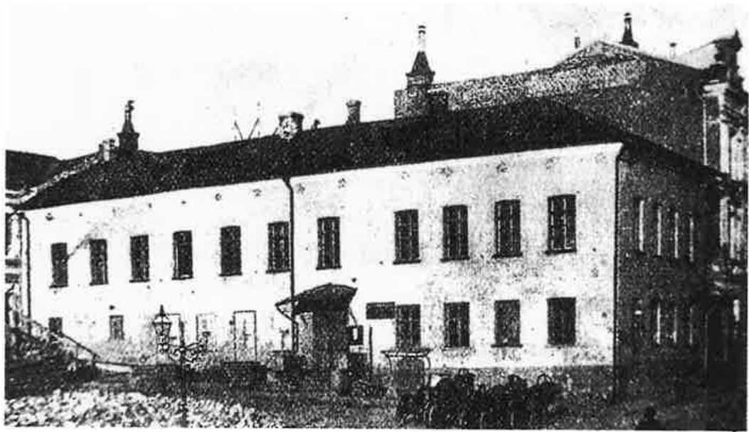
Viipurin vanha raatihuone 1600-luvulta.