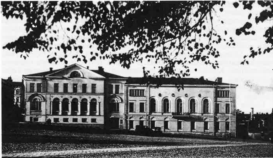
Viipurin kaupungintalo Uno Ullbergin 1930-luvulla uusimana.

sekä porrasmaisesti päättynyt tiilikatto, kuten 1600-luvun porvaritaloissa yleensä. (Viistein mukaan)