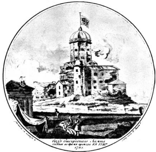
Monilahjakas Nikolaj Lvov teki etsauksen Viipurin linnasta seurattessaan Katariina II:ta tämän virallisella matkalla Suomessa kesäkuussa 1783.

Keisarillinen avokätisyys ulottui uskonnon piiriä laajemmalle. Vuonna 1793 tulen tuhottua lähes puolet ”jalosta” Viipurin kaupungista Katariina II myönsi 50 000 ruplaa jälleenrakennukseen, mikä ei kuitenkaan kattanut kuin muutaman kivitalon tai parin tusinan puutalon hinnan. 27 Siitä 37 600 ruplaa koostui kahdeksan vuoden korottomasta lainasta asukkaille. 28 Vuonna 1794 hyväksytyn suunnitelman mukaan kaupunki oli tarkoitus rakentaa uudelleen kivistä, ja useita katuja oli tarkoitus levenittää. Suunnitelmaa ei voitu toteuttaa kokonaan, mutta muutokset olivat silti huomattavia: kaupunkiin nousi uusia, upeita kaksikerroksisia taloja, joissa nähtiin uudenaikaisia koristeluja kuten päätykolmioita, parvekkeita ja rautaaitoja. Useimmat julkiset rakennukset korjattiin ja koristeltiin. 29 Kristuksen kirkastuksen katedraalin lähelle nousi uusi raatihuone ja suunniteltiin uutta kuvernöörin palatsia. Tämä moderni uusklassinen keskusta, ”järjellä ja kau- neudella rakennettu”, oli arvattavasti venäläisten eniten arvostama osa kaupunkia. 30 Vuonna 1799 katedraaliaukio tai oikeammin kulmittain sen kanssa muodostunut paraatikenttä sai luterilaisesta kirkosta uuden monumentaalisen todisteen Venäjän hallitsijan avokätisyydestä ja avarakatseisuudesta. Kuusi vuotta aiemmin Katariina oli nimittäin hyväksynyt myös luterilaisen kirkon rakennussuunnitelman. Alun perin kirkko oli tarkoitus nimetä pyhän Katariinan kirkoksi anteliaan keisarinnan kunniaksi, mutta kirkon pyhittä-