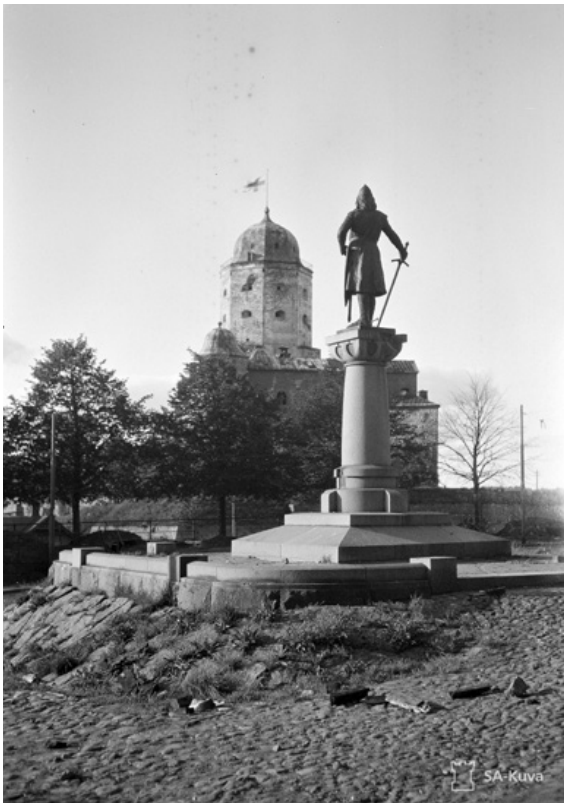
Viipurin linnassa hulmuava Suomen lippu ja Torkkeli Knuutinpojan patsas jatkosodan alussa

Vingahti viimana taas sotajousi vierellä Viipurin vanhan muurin. Taivaalle latvoin ja paatehen juurin hulmahti lippu ja salkohon nousi.